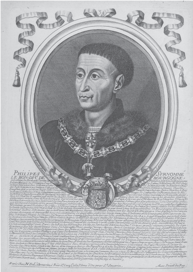
Filips de Goede met de keten van de door hem gestichte Orde van het Gulden Vlies

subsidies ging om buitengewone beden voor bepaalde, welomschreven doeleinden. De vaststelling van de grootte van de bedragen, de instemming met de beden, groeide uit tot een belangrijk pressiemiddel in handen van de Staten. Aan hun instemming met de financiële verzoeken, die voor de vorst onmisbaar waren en bij ontoereikende inkomsten steeds vaker moesten worden gedaan, konden de Staten politieke voorwaarden verbinden en daarmee een zekere inspraak veroveren in het regeerbeleid.