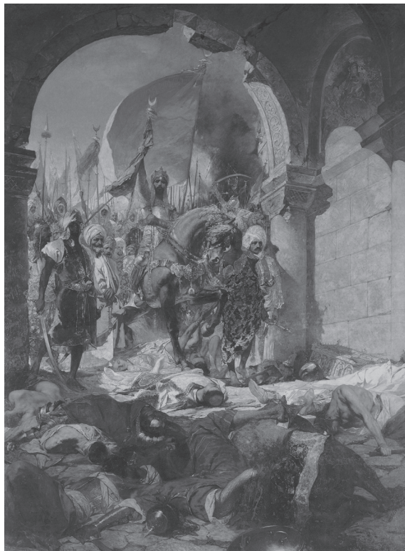
Negentiende-eeuwse voorstelling van sultan Mehmet II die te paard het veroverde Constantinopel binnentrekt

van Constantinopel hem niet meer los en smeedde hij plannen voor een kruistocht tegen Mehmet en de zijnen. De hertog deed plechtige beloften en nadat de inmiddels tegen de zeventig lopende Filips in 1463 van een ernstige ziekte was hersteld, leek hij de laatste kans te grijpen om zijn beloften eindelijk gestand te doen. Filips' kruistochtplannen, die hij in overleg met paus Pius II maakte, namen steeds vastere vormen aan en raakten ook in de Nederlanden bekend. Een mogelijk vertrek van Filips om oorlog te voeren tegen de Turken wekte onrust, ook omdat de verhouding van de hertog met zijn zoon en vermoedelijke opvolger Karel, die de titel 'graaf van Charolais' droeg, ronduit slecht was. De onderdanen kregen lucht van de regeling van het bestuur die Filips tijdens zijn afwezigheid had voorzien. Het bewind over de meeste gewesten zou worden toevertrouwd aan de invloedrijke