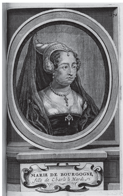
Marie (1457-1482), hertogin van Bourgondië enz. 1477-1482

Marie moest oude privileges van Gent, Brugge, Vlaanderen, Holland en Zeeland in ere herstellen en bovendien kondigde zij op 11 februari 1477 een zogeheten Groot Privilege af, dat voor alle Staten gold. Dit maakte veel centralistische maatregelen van Filips de Goede en Karel de Stoute ongedaan en schafte centrale instellingen als het Parlement van Mechelen (een centraal gerechtshof) en de Algemene Rekenkamer af. In het Groot Privilege beloofde hertogin Marie geen oorlog te verklaren of vrede te sluiten alvorens daartoe met de Staten te hebben overlegd. De positie van de Staten werd versterkt, omdat zij het recht kregen zowel gezamenlijk als afzonderlijk te vergaderen, uit eigen beweging, waar en wanneer zij wilden. De terreinen waarop de Staten-Generaal bevoegd waren, werden omschreven als 'de saken, welvaert ende prouffeyt van onsen ghemeenen landen'. Hierdoor werden de Generale Staten overigens nog steeds geen permanente instelling. Hoewel het Groot Privilege ontegenzeggelijk een belangrijk document is in de geschiedenis van de Nederlanden en de Staten-Generaal, werden