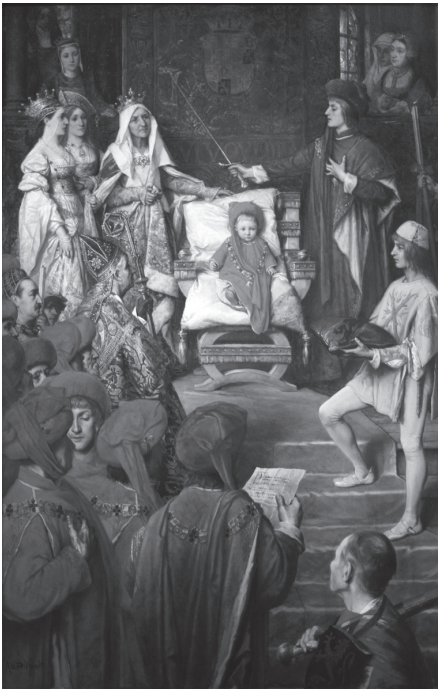
Filips de Schone verleent zijn zoon Karel de Orde van het Gulden Vlies (19e-eeuwse voorstelling)

Filips de Schone werd beschouwd als een 'Nederlandse' vorst, maar zijn huwelijk met de Spaanse erfdochter Johanna bracht dat 'nationale' karakter in gevaar, omdat hij na 1504 in Spanje ging regeren. Op 25 september 1506 overleed Filips daar en volgde zijn jonge zoontje Karel hem op. Diens grootvader Maximiliaan werd wederom regent, maar hij liet het bestuur over de Nederlanden grotendeels over aan zijn dochter Margaretha. Beiden kwamen soms lijnrecht tegenover de Staten-Generaal te staan. Het verzet van de Staten-Generaal tegen de door dynastieke belangen bepaalde oorlogspolitiek van Maximiliaan en Margaretha leidde er meermalen toe dat de Staten-Generaal de gevraagde financiële steun weigerden. Bij het einde van Maximiliaans regentschap slaakten zij een zucht van verlichting. Op 5 januari 1515 verscheen de jonge hertog Karel V in de vergadering van de Staten-Generaal te Brussel en aanvaardde hij persoonlijk het bewind.