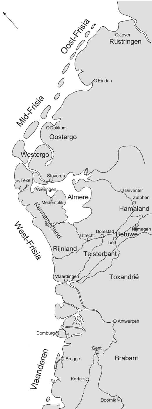
Overzichtskaart van de Lage Landen in de vroege middeleeuwen.