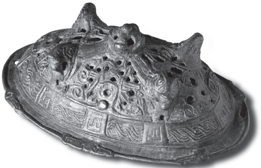
Opengewerkte bronzen ‘schildpad’-fibula uit de negende of tiende eeuw. Dit soort grote mantelspelden werd door Scandinavische vrouwen gedragen.

Ten zuiden van de grote rivieren was vervoer nog wel mogelijk over de vaak vervallen Romeinse wegen, maar noordelijker werd bijna alles over water getransporteerd. Bewoners van de noordelijke gebieden waren daardoor vanouds met scheepvaart vertrouwd geraakt.