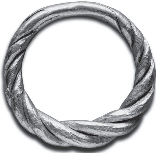
Gouden vingerring van Scandinavische afkomst met drie getwiste gouden draden die aan de uiteinden aaneengesmeed zijn, gevonden bij Wijk bij Duurstede.

Met het debacle van Walcheren zitten we midden in een reeks van gewelddadige optredens van de Noormannen in de Lage Landen. We herkennen het beeld dat vrijwel iedereen van hen heeft: dat van brute woestelingen die voor niets of niemand ontzag hadden. Bij de aanval op Walcheren komt de falende verdediging en de machteloosheid van de Frankische vorsten tot uiting. Ook blijkt de terughoudendheid van de Friese vrachtvaarders om de Frankische machthebbers te hulp te schieten. Daarmee zijn meteen enkele belangrijke aspecten van het optreden van de Noormannen in onze streken aan het licht gebracht.