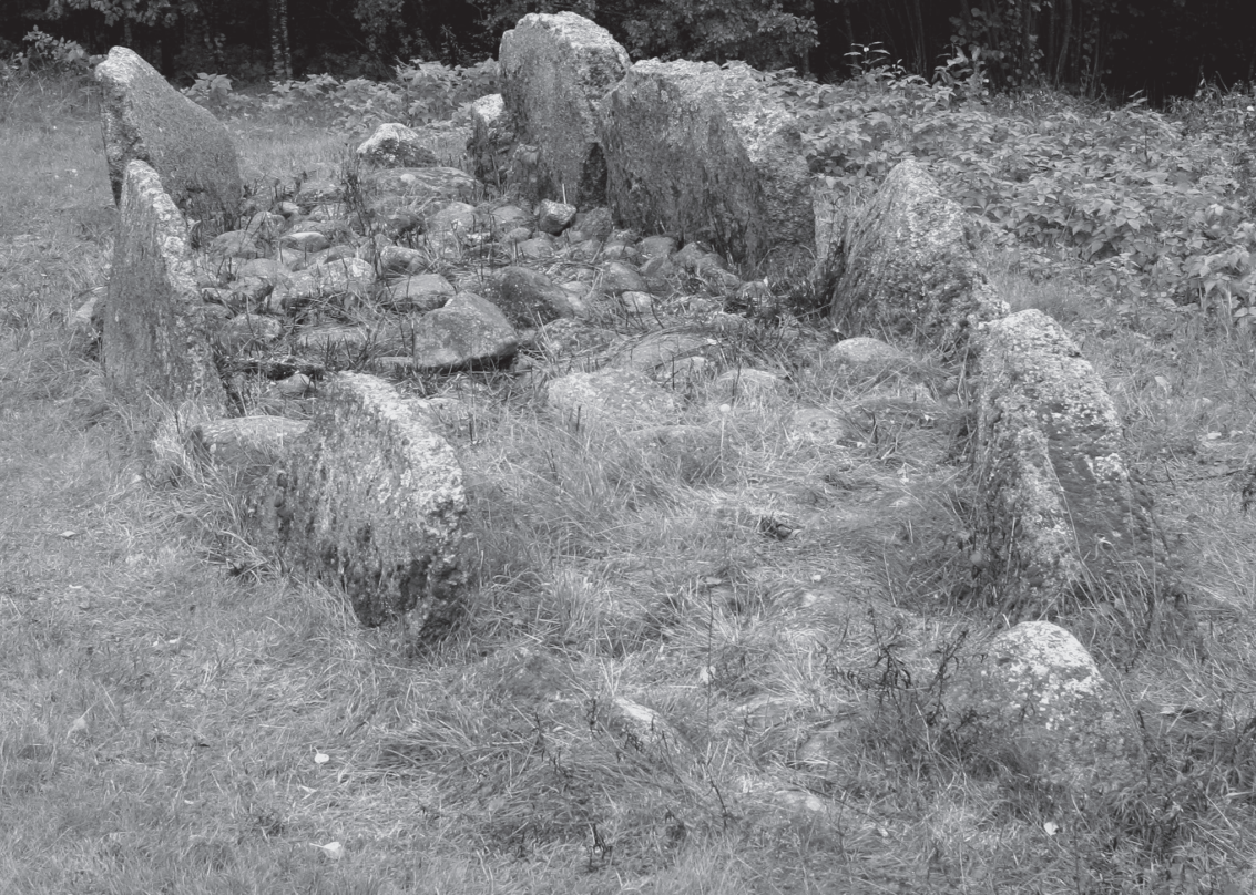
Symbolisch scheepsgraf van stenen in het grafveld van Istrehågan bij Tjølling in Noorwegen.

treerd. Sommige verhalen, zoals veel heiligenlevens, werden soms pas generaties later opgetekend.