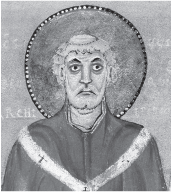
Willibrord. Miniatuur uit een graduale (boek met misgezangen) uit de elfde eeuw.

gezag geen sprake was. Door de fijnmazige organisatie tot op lokaal parochieniveau vervulde de kerk tevens een belangrijke controlerende functie.