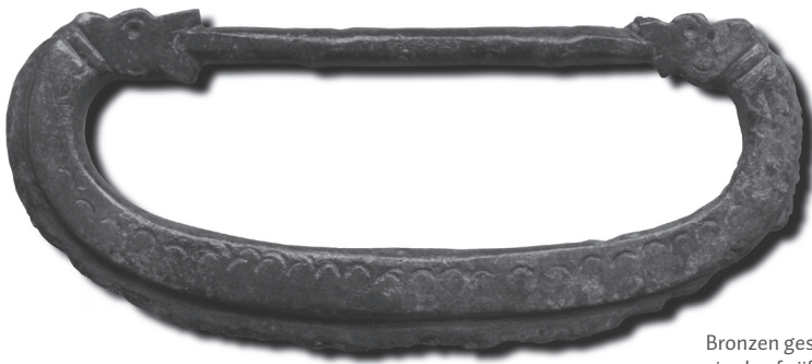
Bronzen gespeugel uit de vierde of vijfde eeuw met versieringen in de vorm van twee dierenkoppen.

We laten de geschiedenis van deze heersers in het volgende hoofdstuk beginnen op het moment dat hun macht begon uit te breiden. Maar voordat de eerste koning Childerik ten tonele wordt gevoerd, kijken we eerst naar de voorgeschiedenis van deze vorst en die van het Frankische volk.