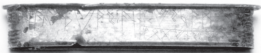
Zwaardschedebeslag met runen uit Bergakker.

In Bergakker, ten westen van Tiel, werd een zeldzaam verguld zilveren beslagstuk van een zwaardschede uit de vroege vijfde eeuw gevonden. In dit beslagstuk zijn runen gekerfd die geïnterpreteerd kunnen worden als 'Van Halethewaz die zwaardvechters van zwaarden voorziet'. Het zijn Frankische runen, tot nog toe de vroegste runenvondst uit onze streken. Misschien was Halethewaz een Frankische immigrant in het voormalige gebied van de Bataven. 9