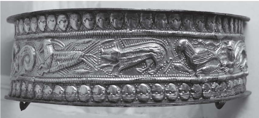
Verguld en verzilverd bronzen gordelbeslag uit Sleeswijk, Noord-Duitsland. Een Germaanse edelsmid heeft zich door Romeinse voorbeelden laten inspireren.

Behalve koning Chlodio noemde Gregorius van Tours ook, haast terloops, de semilegendarische koning Merovech. Gregorius twijfelde of deze schimmige figuur, de naamgever van het vorstenhuis van de Merovingen, geparenteerd was aan koning Chlodio. Wel was hij ervan overtuigd dat Merovech de vader was van Childerik I, de vorst die zijn dynastie door een bondgenootschap met de Romeinen een stevige basis wist te geven.