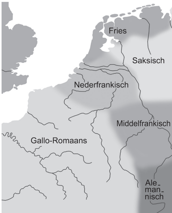
Vereenvoudigde verspreidingskaart van de vroegmiddeleeuwse talen in onze omgeving.

In de vijftiende eeuw werden veel Germaanse begrippen onder invloed van de renaissance vervangen door Latijnse woorden. Er ontstond een gecultiveerde Franse taal, waarvan het door de Franken beïnvloede dialect dat in het noorden, rond het machtige Parijs, in zwang was, tot de standaard verheven werd.