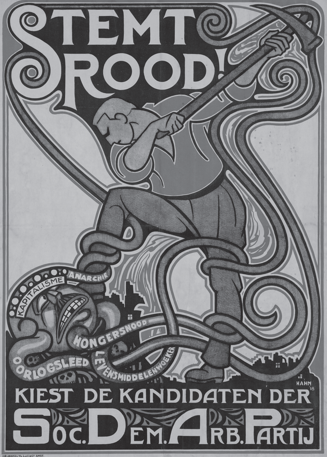
Affiche van de SDAP voor de Tweede Kamerverkiezingen van juli 1918.