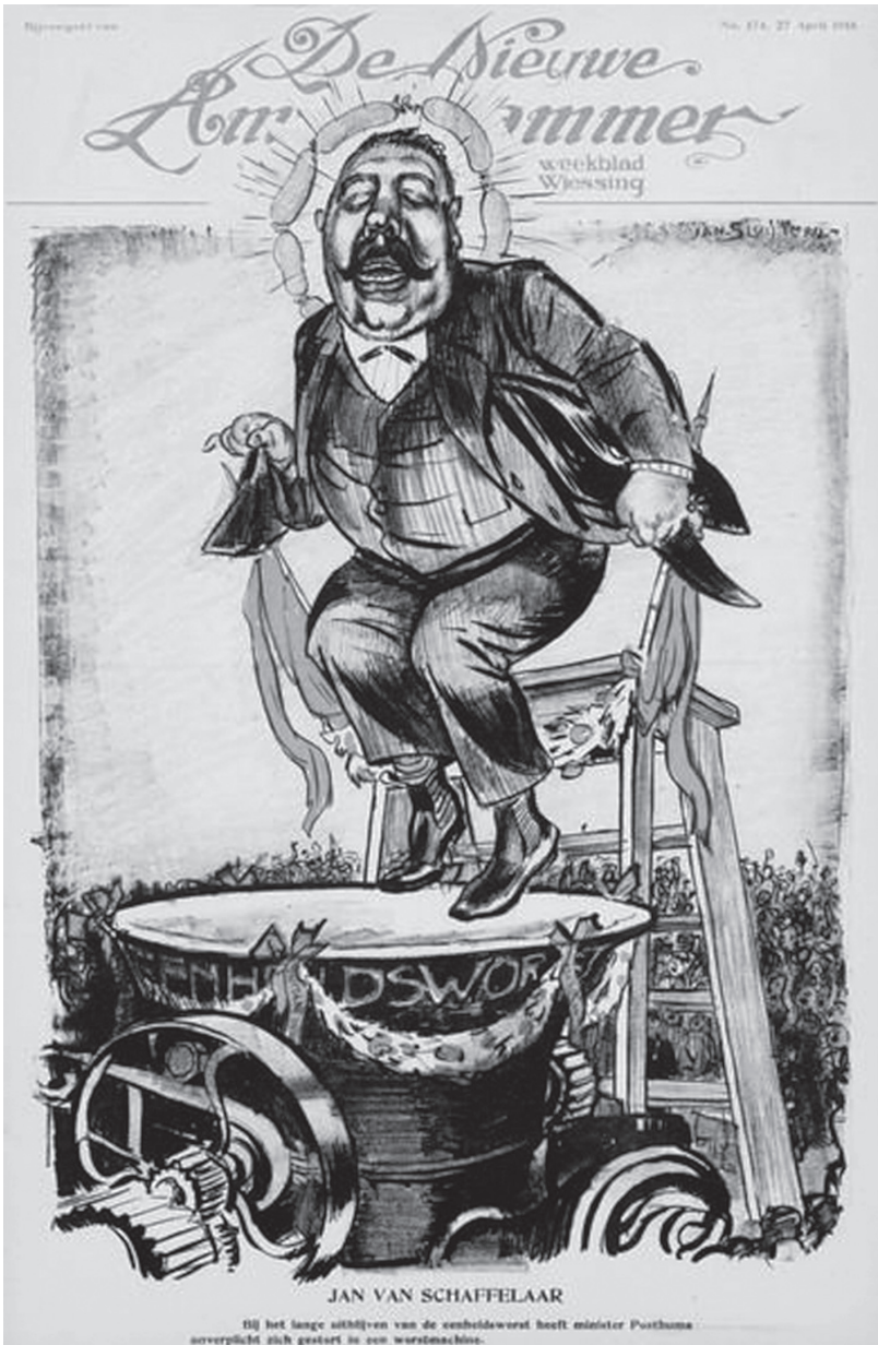
Minister Posthuma, verantwoordelijk voor de voedselvoorziening, offert zich op en werpt zich in de machine die de eenheidsworst produceert. Tekening Jan Sluyters, De Nieuwe Amsterdammer , 27 april 1918.