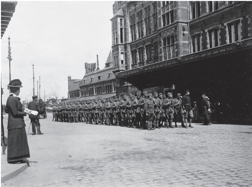
Aardappeloproer, juli 1917: militairen voor het Centraal Station van Amsterdam.

Aanvankelijk leek Nederland economisch te profiteren van de oorlog. Het uitbreken van de oorlog in augustus 1914 had weliswaar een korte crisis veroorzaakt, maar in de loop van 1915 en 1916 nam de werkloosheid af en groeide het nationale inkomen. Vanaf de winter van 1916-1917 stagneerde echter de aanvoer van grondstoffen en halffabricaten, zodat de werkloosheid weer snel steeg en een zorgwekkend niveau bereikte. In de jaren voor de oorlog was er een begin gemaakt met de financiële steun aan werklozen; de uitvoering