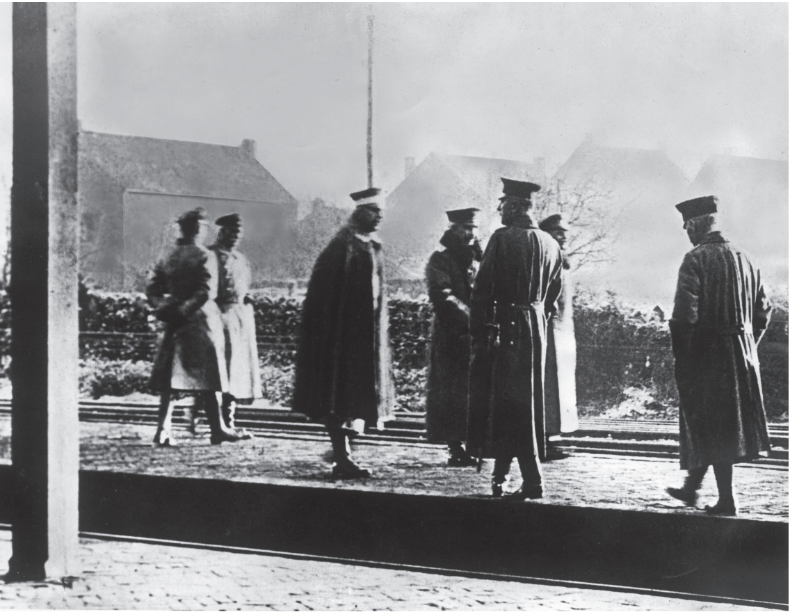
Wilhelm II (midden) op het station van Eijsden.