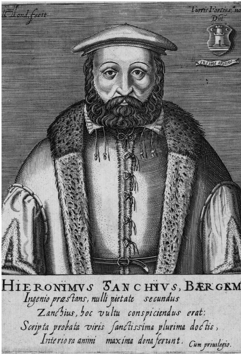
Portret van de hervormer Hieronymus Zanchius, hoogleraar te Heidelberg. Prent Hendrick Hondius, 1599 (Rijksmuseum, Amsterdam).