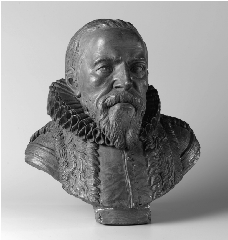
Borstbeeld van Johan van Oldenbarnevelt. Anoniem, zeventiende eeuw (Rijksmuseum, Amsterdam).

bouwde het ambt van Hollands landsadvocaat uit tot een functie die hem in de hele Republiek macht en invloed verschafte. De dominante positie en de belangen van Holland stonden bij hem echter voorop. Oranjegezinden hebben zelf het vertekende beeld van Oldenbarnevelt als ‘anti-Oranje’ eeuwenlang versterkt, door hem zijn rechtmatige plaats in de eregalerij der vaderlandse groten te ontzeggen, uit vrees om prins Maurits op enigerlei wijze tekort te doen en/of de regerende dynastie voor