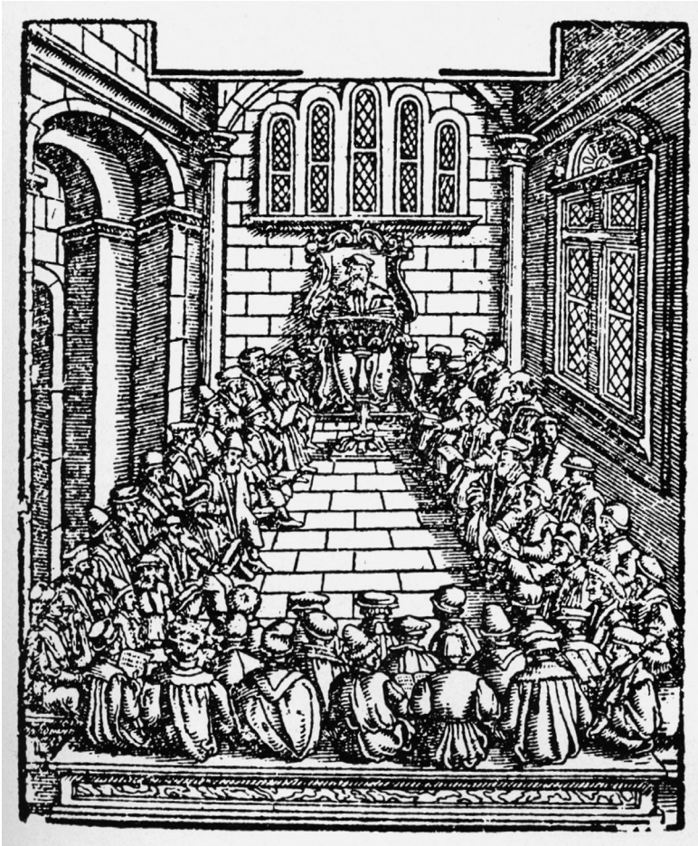
'Hohe Schul zu Heydelberg', Universiteit van Heidelberg. Houtsnede uit 'Cosmographia Universalis' van Sebastian Münster, 1544.

In Heidelberg koos Johan van Oldenbarnevelt definitief voor 'de nieuwe leer'. Met zijn oude universiteit vormde Heidelberg destijds onder keurvorst Frederik III 'de Vrome' van de Palts het wetenschappelijke centrum van het calvinisme. Er bevonden zich ook tal van hervormden die de Nederlanden en Alva's