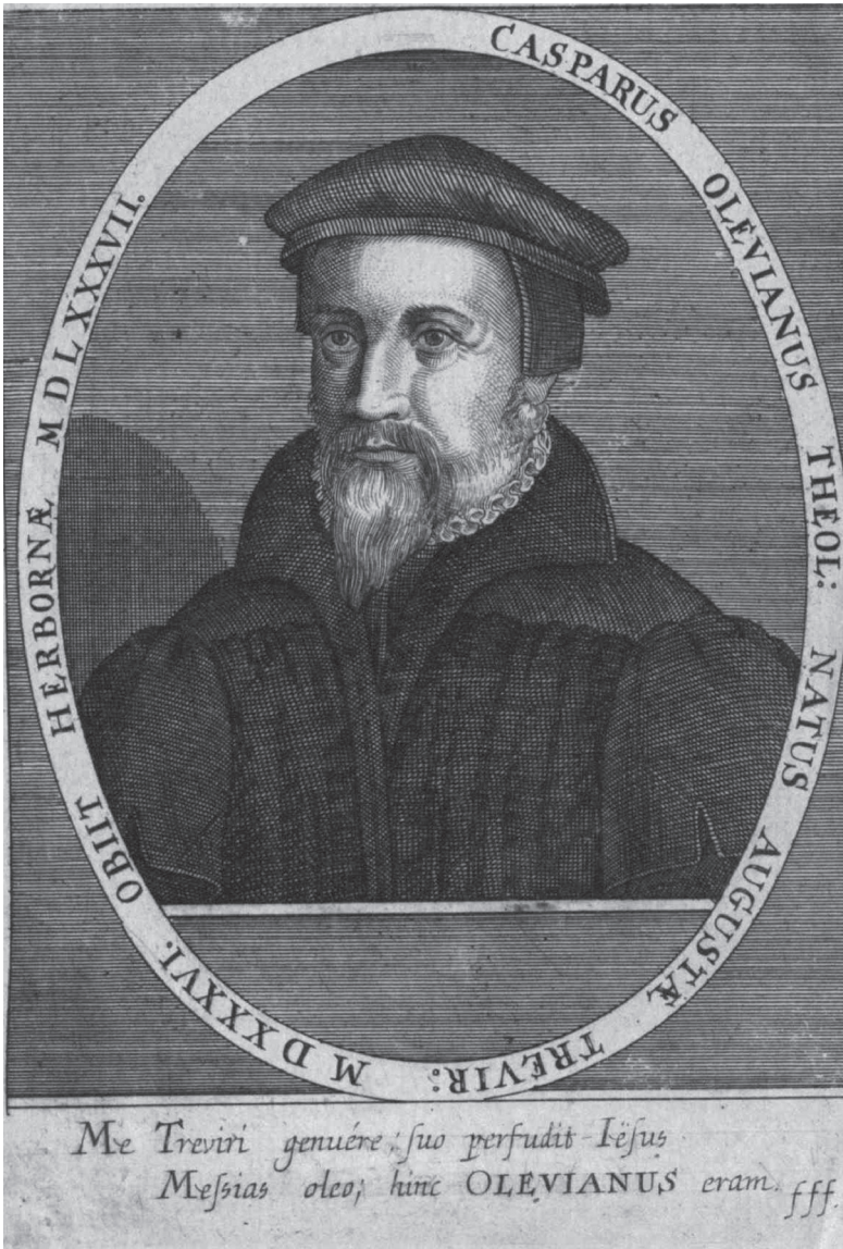
Portret van Casparus Olevianus, predikant te Heidelberg. Prent zestiende eeuw (Österreichische Nationalbibliothek, Wenen).