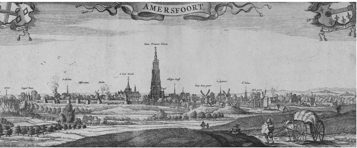
Gezicht op Amersfoort. Ets Steven van Lamsweerde, zeventiende eeuw (Rijksmuseum, Amsterdam).

de bisschoppen van Utrecht en anderen, ook in de handelingen met de heren van Amstel en de heren van Woerden, tot de voornaamste ridders werden gerekend, hebbende ettelijke duizenden morgen land en vele schone heerlijkheden, heerlijke goederen en rechten bezeten.’ 2