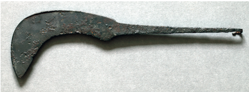
Granen werden met sikkels geogst, zoals dit exemplaar uit York.

Na de zomer moest de boer al vroeg oogsten. Het hooi moest van het land worden gehaald voordat de winter inviel. Dan werd ook een deel van de veestapel geslacht en moest er vlees voor de winter worden ingezouten. Behalve vlees leverde het vee ook melkproducten en wol. De vrouwen op de boerderij kaarden de wol en sponnen die op hun spintollen, waarna het garen op een eenvoudig staand weefraam tot een stof werd geweven.