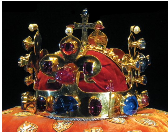
De Wenceslas kroon van Bohemen.