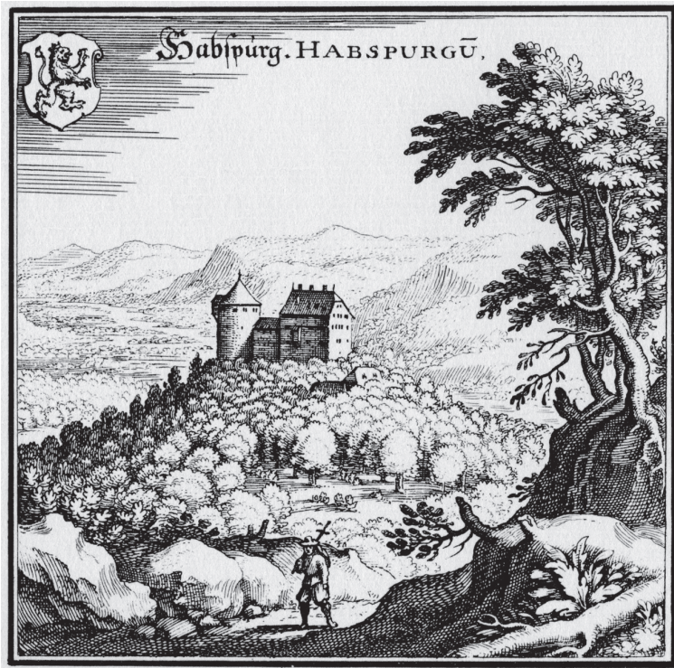
Gravure van Matthäus Merian, 1642. Uit de Topographia Helvetiae , 1642. Aan de rivier de Aar in het Zwitserse Aargau bouwden zo rond het jaar 1020 graaf Radboud van Klettgau en zijn broer Werner, de latere bisschop van Straatsburg, deze 'haviksburcht' op de Wülpelsberg.

bijkans denigerende betekenis, omdat deze herinnerde aan een provinciaals verleden dat men achter zich had gelaten. Toen rond 1415 keizer Sigismund hertog Ernst van Oostenrijk aansprak als 'Heer van Habsburg', vatte deze dat dan ook op als een belediging en sprak de keizer vervolgens aan als 'Heer van Luxemburg'. Pas in het begin van de negentiende eeuw kwam de naam Habsburg weer in omloop, deels als gevolg van Schillers populaire ballade Der Graf von Habsburg (1803).