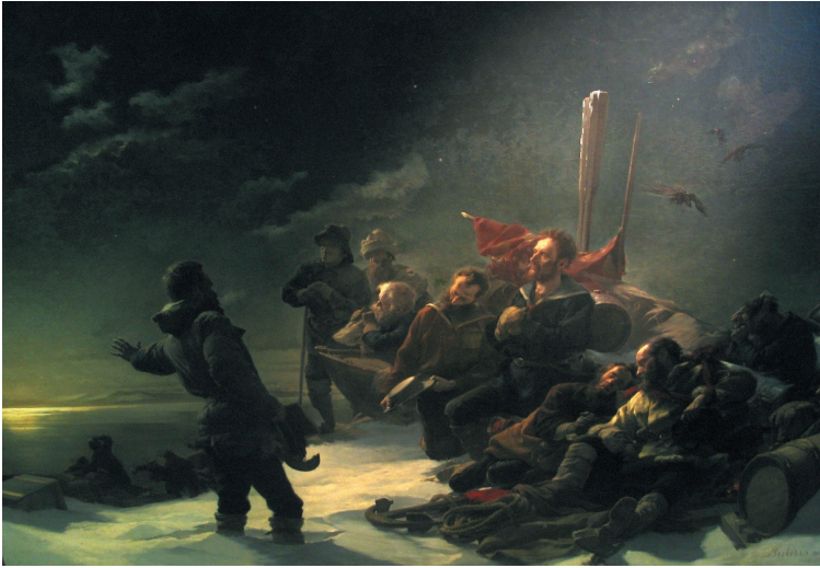
Schilderij van Julius Payer, 1892. Heeresgeschichtles Museum, Wenen . Een van de leiders van de Oostenrijks-Hongaarse poolexpeditie was Julius Payer, de schilder van het doek. De expeditie kwam langdurig vast te zitten in het ijs. Terug in Wenen kreeg de expeditie een heldenontvangst.

van Rusland nog altijd bekend als Frans Jozefland, ter herinnering aan keizer Frans Jozef (1848-1916).