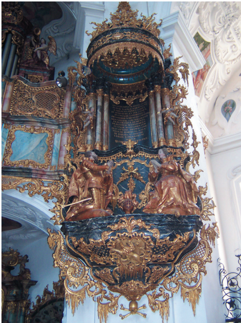
Klosterkirche, Muri. Het gedenkmonument in de Kloosterkerk van de abdij van Muri, ter herinnering aan graaf Radboud: de grondlegger van de dynastie van de Habsburgers.

Vanaf het moment dat ze in de geschiedenis opduiken, vormden de Habsburgers een illustere familie. In de tiende eeuw verwierven hun voorouders zich een wisselende reeks heerlijkheden