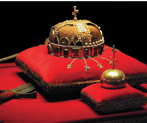
De Hongaarse kroon.