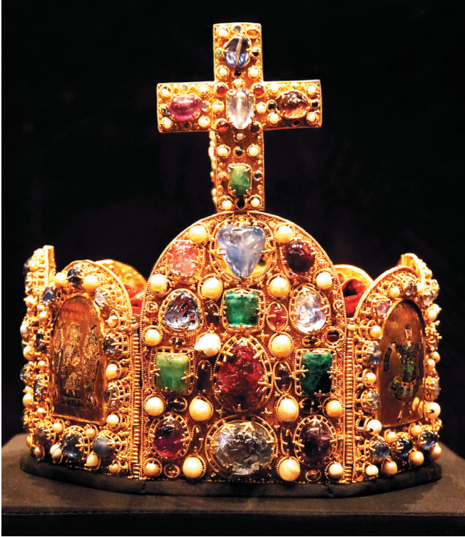
De kroon van het Heilige Romeinse Rijk.