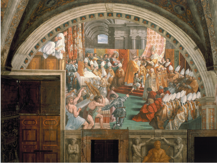
Fresco van Rafaël, 1514. Musei Vaticani, Vaticaanstad.

De keizerkroning van Karel de Grote in 800 maakte hem patronus et advocatus van de katholieke kerk. De eenheid tussen kerk en staat werd onder meer gesymboliseerd toen Karel de banier van Rome en de sleutel van het Heilig Graf in Jeruzalem ontving.