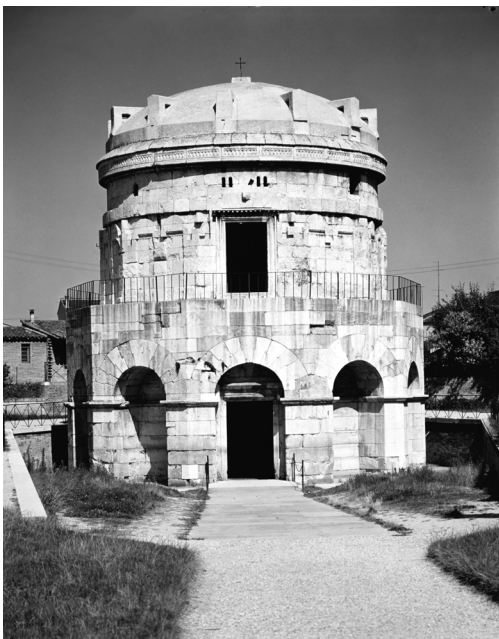
Het mausoleum van Theoderik in Ravenna. De bouw begon een paar jaar voor Theoderiks dood in 526. Het dak van het mausoleum is uit één blok zandsteen van 300 ton gehouwen. Theoderiks stoffelijk overschot werd verwijderd nadat de stad in 540 door de Byzantijnen was veroverd.