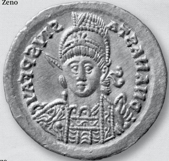
Een gouden solidus, geslagen door Theoderik na zijn verovering van Italië. Theoderik regeerde officieel als de onderkoning van de Oost-Romeinse keizer Anastasius wiens naam op de munt verschijnt, in plaats van die van de Ostrogoot zelf.

De volgende jaren van Theoderiks regering werden overheerst door zijn rivaliteit met Theoderik Triarius, de leider van een afgesplitste groep Goten die de Romeinen een paar jaar eerder als foederati op de Balkan hadden toegelaten. De oostelijke keizer, Zeno (reg. 474-431), wilde niet meer dan één Gotische leider steunen en dus moesten de twee Theoderiks met elkaar wedijveren om de keizerlijke erkenning. Toen Triarius in 478 in opstand kwam, sloot Zeno een bondgenootschap met Theoderik om hem samen aan te vallen. Zeno verzuimde de troepen te leveren die hij beloofd had en uiteindelijk stond Theoderik alleen tegenover zijn rivaal. De Goten weigerden echter tegen elkaar te vechten en de twee leiders verzoenden zich. De keizer verijdelde op zijn beurt dit verbond weer door Triarius een genereuze regeling aan te bieden, inclusief een generaalstitel, waarmee hij zijn verbond met Theoderik en de Ostrogoten verbrak. Woedend om dit verraad, en met een volk dat honger leed, begon Theoderik een meedogenloze plunder- en moordcampagne op de Balkan totdat Triarius weer