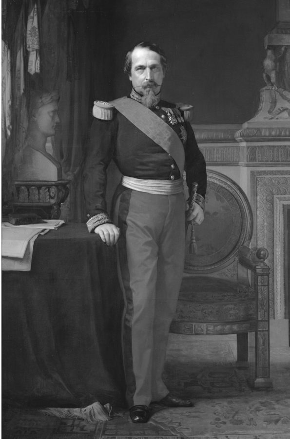
Keizer Napoleon III, die Bismarck en Moltke in 1870 met opzet provoceeden om te mobiliseren voor een oorlog. Napoleon werd bij Sedan gevangengenomen, en ging vervolgens in ballingschap in Engeland. Dit portret, dat uit 1862 dateert, is van de hand van Hippolyte Flandrin.

Vionville op het hele Franse leger. Alleen de uitmuntende Pruisische artillerie, die sinds 1866 sterk verbeterd was, behoedde hen voor een ernstige nederlaag in de morgen. Meer en meer Pruisische troepen werden in de strijd geworpen totdat het rond zeven uur 's avonds in een bloedige patstelling leek te eindigen. De late aankomst van nog meer Pruisische formaties zorgde ervoor dat de Fransen in wanorde van het slagveld werden verdreven.