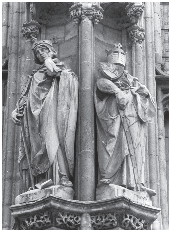
Standbeelden van Robrecht de Fries op het stadhuis van Brugge (rechts) en Gent (links). In Gent wordt Robrecht (rechts) geflankeerd door zijn broer Boudewijn (links).

se economie en welvaart op evenementen zoals de jaarmarkt van Torhout. Robrecht moest de marktvrede waarborgen, voor de aanwezige handelaren en hun klanten, en ook voor zijn eigen inkomsten. Hij redde zich op diplomatieke wijze uit dit dilemma door met een kwinkslag de angel uit het probleem te halen en verder bloedvergieten te voorkomen. In het verhaal spelen ook een heilige man en de wil van God een rol. Het christelijk geloof was aanwezig in het leven van elke middeleeuwer, en al helemaal bij deze graaf, die zich bemoeide met kloosters en bisdommen, op bedevaart ging naar Jeruzalem en persoonlijk correspondeerde met de paus in Rome.