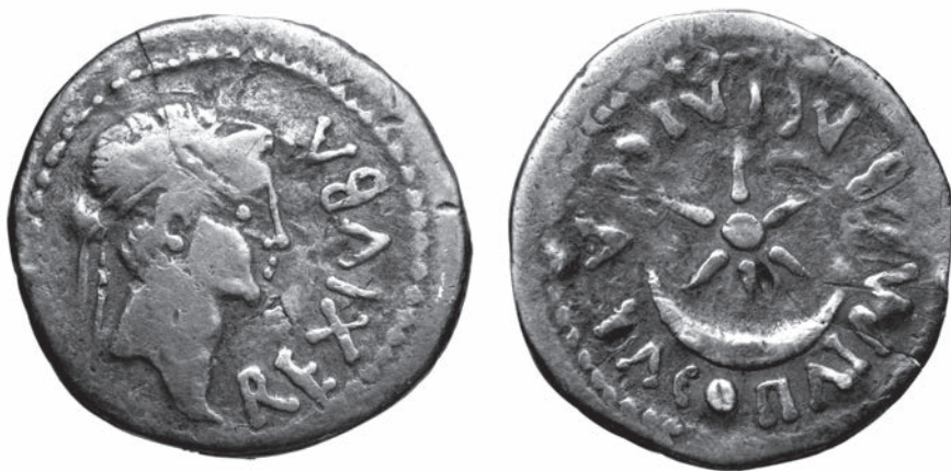
Een munt met de afbeelding van Juba en de Latijnse legende REX IUBA op de voorzijde, en de zon en maan en de Griekse legende BASILISSA KLEOPATRA aan de achterkant.

Veel bewaard gebleven kunstwerken uit de vroege keizerlijke periode hebben generieke trekken. De portretten van Juba en hun zoon Ptolemaeus in het Louvre zijn bijvoorbeeld geheel in overeenstemming met de standaard die Augustus met zijn officiële portretten creëerde. Daarentegen zijn de vermeende portretten van Cleopatra Selene aanzienlijk interessanter en informatiever, bijvoorbeeld de openbare marmeren standbeelden die uit Mauretania afkomstig zijn, en de privéportretten in edelmetaal die op andere plaatsen in het Romeinse Rijk bewaard zijn gebleven, zoals de zilveren schaal uit Boscoreale en het portret in zilver en verguldsel die hierboven