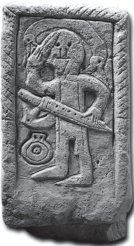
Frankische grafsteen uit de zevende eeuw met een gewapende krijger, gevonden in Niederdollendorf bij Bonn.

of de tong lieten uitrukken. Hier en daar liggen de lijken letterlijk hoog opgestapeld.