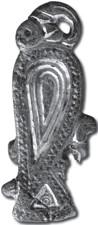
Verguld zilveren vogelfibula, vroeg Merovingisch, gevonden in Wijk bij Duurstede.

voortdurende conflict tussen koningen en edelen, het machtsspel van de sociale bovenlaag. Terwijl de straatarme bevolking wat voedsel van het land probeerde te schrapen en sterfte door ondervoeding aan de orde van de dag was, speelden schatrijke aristocraten hun machtsspel over de ruggen van diezelfde bevolking.