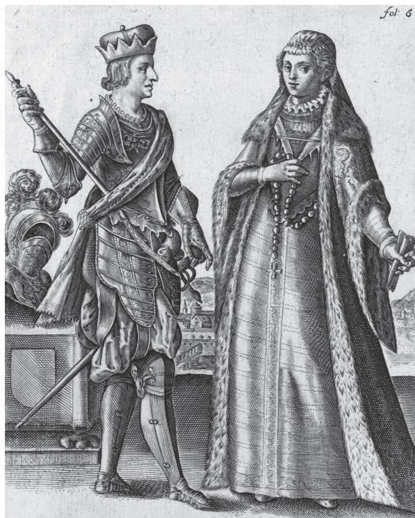
fol. 6 Dubbelportret van Maximiliaan I van Habsburg en Maria van Bourgondië. Gravure Simon van de Passe, zeventiende eeuw.

van Oostenrijk, dat op 19 augustus 1477 in Gent werd voltrokken. Maximiliaan, de oudste zoon van keizer Frederik III, bracht veel geld, prestige en militaire expertise in. Het was meegenomen dat de echtelieden elkaar ook in andere opzichten aantrekkelijk vonden. Na haar huwelijk had Maria nog wel een aandeel in het landsbestuur maar liet zij veel over aan haar echtgenoot. Maximiliaan bekrachtigde de gewestelijke privileges maar niet het Groot Privilege. De Staten-Generaal werden weer een passief orgaan, dat uitsluitend bijeenkwam wanneer de landsheer overleg wilde plegen.