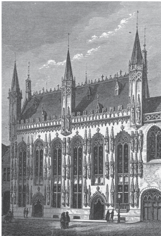
Het Stadhuis te Brugge. Houtgravure Johann Georg Hechler naar tekening van Victor de Doncker, 1873.

vader en zoon bleef echter gespannen, totdat Karel, graaf van Charolais, op 27 april 1465 tijdens een plechtige bijeenkomst van de Staten-Generaal te Brussel officieel werd erkend en bevestigd als wettige erfgenaam van de landsheerlijke waardigheden.